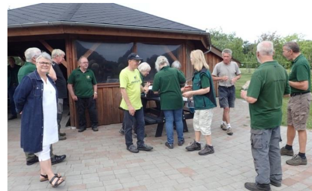
Dagen blev fejret med champagne og kransekage.

Vi oplever da også en meget stor interesse for Haven. Brugere af Haven har fået øjnene op for alle de muligheder, den indbyder til. I disse coronatider har vores gæster haft megen glæde af vores mange siddepladser til møder, familiearrangementer m.m.